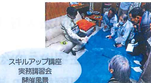
スキルアップ講座 実務講習会 開催風景